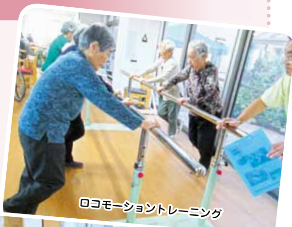
ロコモーショントレーニング

和幸園デイサービスセンターでは午前中は個別に訓練を行い、午後にはみんなで体操と歩行運動を行います。暖かい日は施設の庭でお花を見ながら歩行します。体操は、《北国の春》と《365歩のマーチ》の音楽に合わせ、機能訓練士の掛け声で行いますが、皆さんリズムカルに、はつらつと取り組んでいます。若さの秘訣ですね。