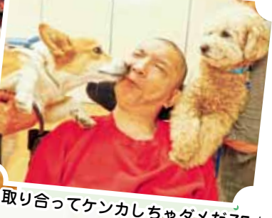
俺を取り合ってケンカしちゃダメだZE☆