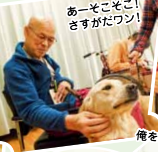
あーそこここ! さすがだワン!