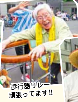
歩行器リレー 頑張ってます!!