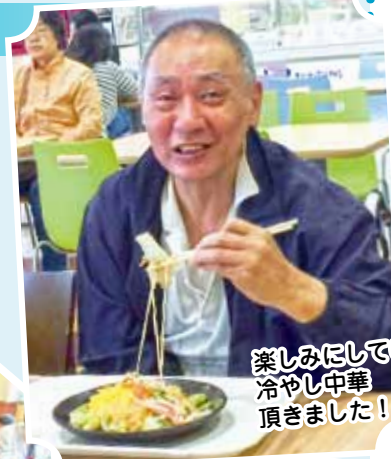
楽しみにしていた冷やし中華 頂きました！

5月23日（火）今年度1回目の外出行事に行ってきました。当日は肌寒い天気となりましたが、気持ちは熱く、そして少し暖かめの格好でご利用者スタッフともに楽しく出発。アリオ・札幌ビール園では楽しみにしていたショッピング・昼食を皆さん満喫されていました。楽しみ疲れて、帰りの車内ではウトウトされている方もいらっしゃいました。