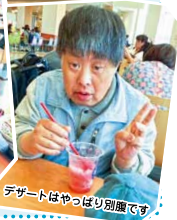
デザートはやっぱり別腹です