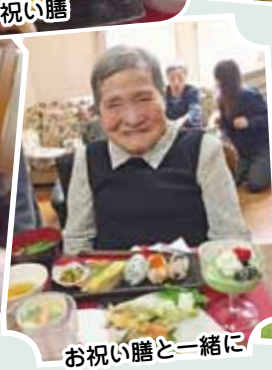
お祝い膳と一緒に