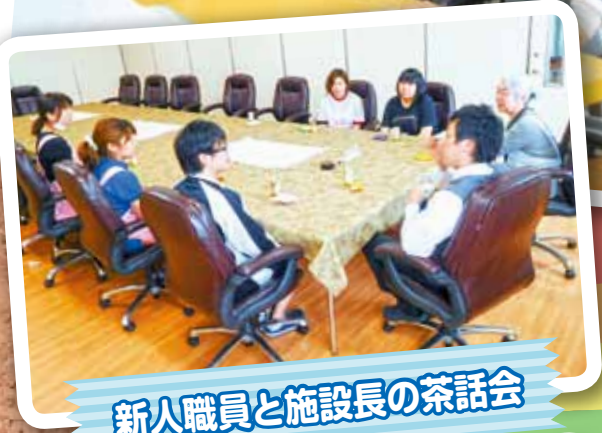
グリーンハイム新人職員