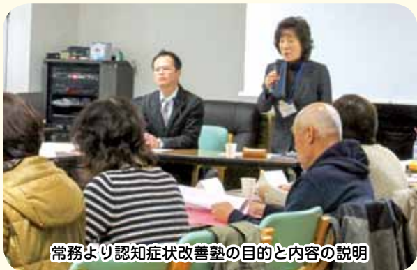
常務より認知症状改善塾の目的と内容の説明

竹内理論に基づく和幸園での日々の介護で実践してきたノウハウを、第1期～第3期の認知症状改善塾の反省を踏まえて、地域の方々にお伝えすることで、認知症状を改善・消失し、よりご本人と介護される方が豊かな在宅生活を送れるよう、活動していきたいと考えております。