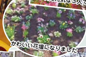
かわいい花壇になりました