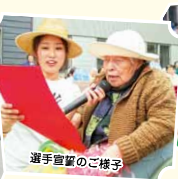
選手宣誓のご様子