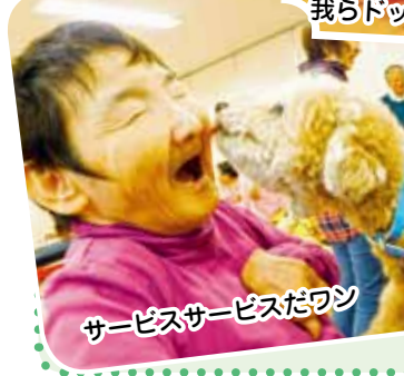
サービスサービスだワン