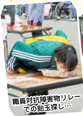
職員対抗障害物リレー での鉛玉探し...