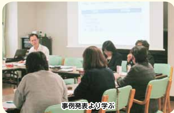
事例発表より学ぶ