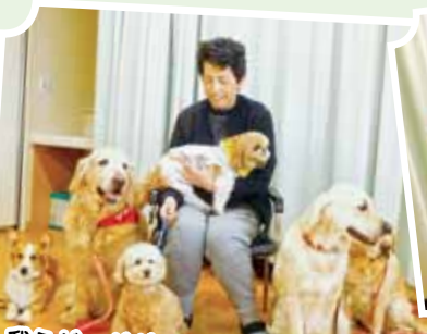
我らドッグダンスチーム札幌ワンズ!

平成29年4月18日（火）、ドッグダンスチーム「札幌ワンズ」さんの今年最初の訪問がありました。待望のワンちゃんたちとのふれあいに、たくさんのご利用者が参加して下さいました。ご利用者も我々職員も人懐っこさに癒され、かわいさにメロメロでした(●^o^●)