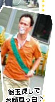
鉛玉探しで お顔真っ白!!