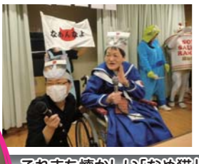
これまた懐かしい「なめ猫」