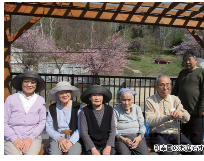
和幸園のお庭です

暖かい気候に待ちきれず、今年は桜の開花が早まりましたね。和幸園デイサービスセンターでは桜が満開の石山緑地に散策へ出かけました。また真駒内や中ノ沢方面の桜並木がとても綺麗で、お花見ドライブにも行ってきました♪また来年もお楽しみに!