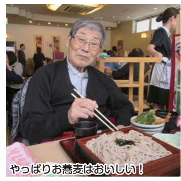
やっぱりお蕎麦はおいしい!

とんでんについては事前に決めておいたお寿司や蕎麦などを美味しく召し上がり、とても満足いく外出行事でした。