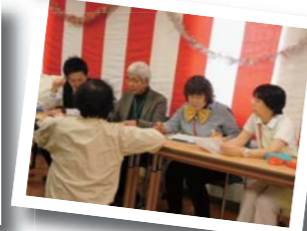
審査も熱が入ります。