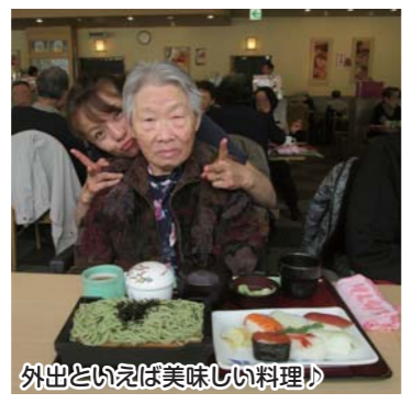
外出といえば美味しい料理♪