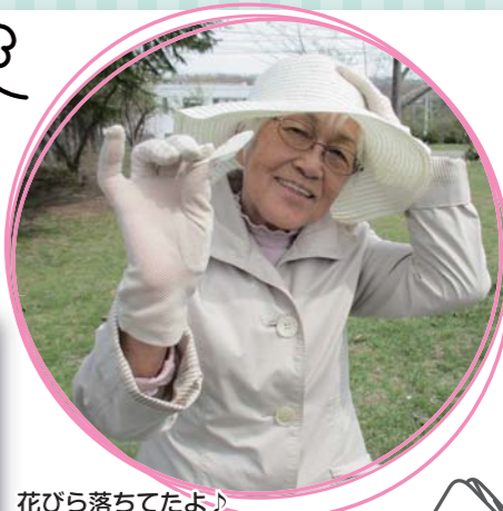
花びら落ちてたよ!