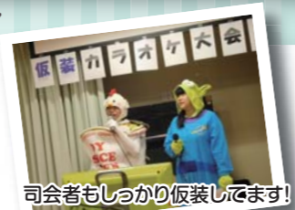
司会者もしっかり仮装してます!

各フロアの個性や奇想天外さが出た大変楽しい大会になり、当初の予定が変更され、全フロアに金賞が贈られました。皆様の笑顔が印象的なイベントとなり、大成功でした!