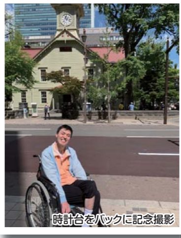
時計台をバックに記念撮影

5月22日(水)今年度1回目の外出行事に行ってきました。当日は晴天となり、元気に出発です。札幌駅に到着され職員とペアになり、楽しみにされていたショッピングや、地下歩行空間など周辺を散策されました。そして美味しい昼食を召し上がり皆さん満喫されていました。楽しい時間はあっという間に過ぎ、車両内で1日の思い出をお話しながら笑顔で帰宅されました。