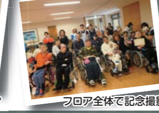
フロア全体で記念撮影