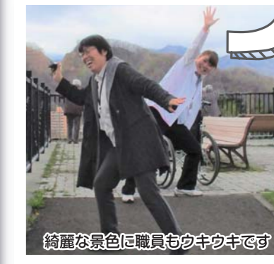
綺麗な景色に職員もウキウキです