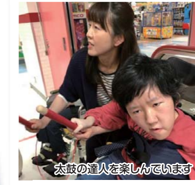
太鼓の達人を楽しんでいます