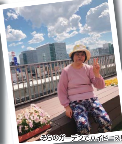
そらのガーデンでハイピース!