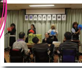
バックダンサーが気になります。