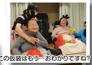
この仮装はもう...おわかりですね?