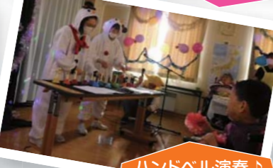
ハンドベル演奏♪素敵な音色でした♪