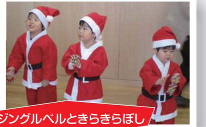
ジングルベルときらきらぼし