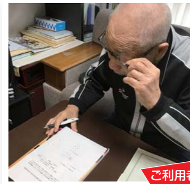
ご利用者のお宅で...