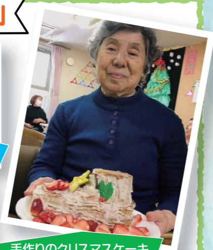
手作りのクリスマスケーキ