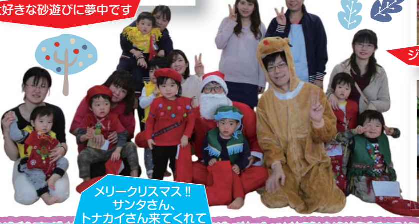
メリークリスマス!! サンタさん、トナカイさん来てくれてありがとう