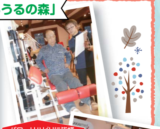
パワーリハビリに皆様真剣に取り組んでいます。