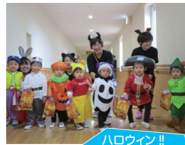
ハロウィン!! 衣装をして施設内を行進しました。お菓子ありがとう