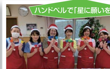
ハンドベルで「星に願いを」