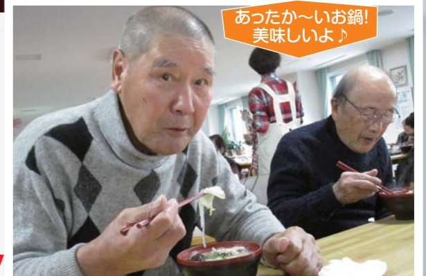
あったか~いお鍋!美味しいよ♪