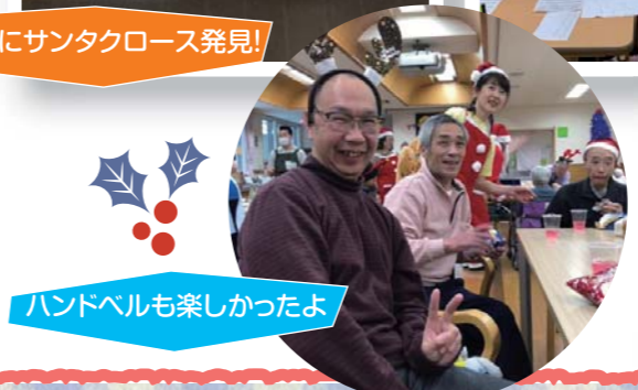
ハンドベルも楽しかったよ