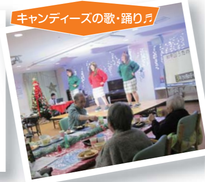
キャンディーズの歌・踊り♪