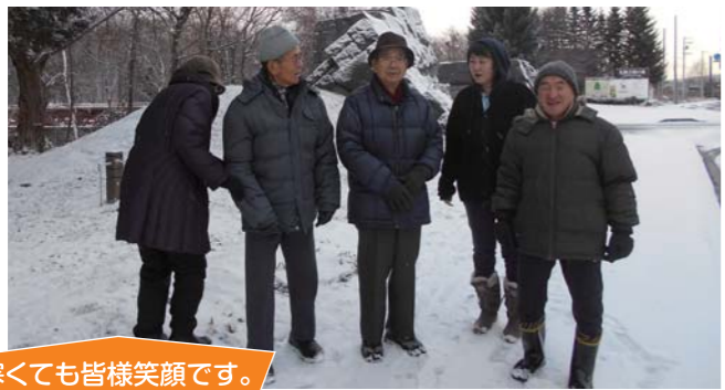
寒くても皆様笑顔です。