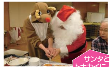
サンタとトナカイによるケーキ入刀!!