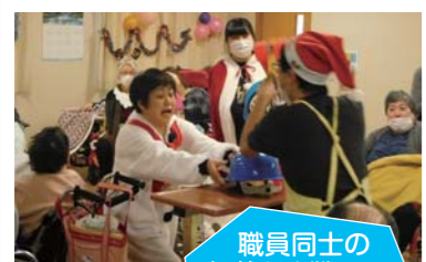
職員同士の仁義なき戦い...「叩いてかぶってジャンケンポン!」