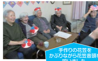
手作りの花笠をかぶりながら花笠音頭を唄いました。