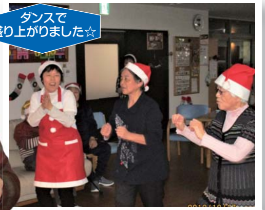
ダンスで盛り上がりました☆