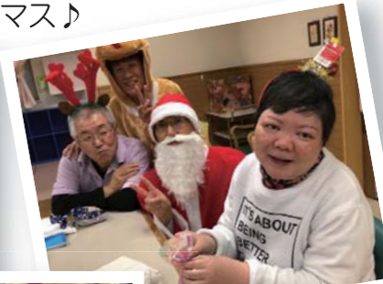
プレゼント何かな?