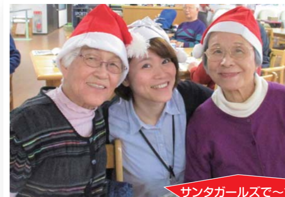
サンタガールズで~す♡