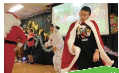
みんなで一緒に「パプリカ」を踊りました♪