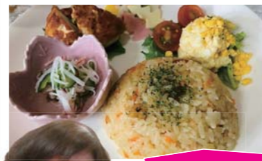
クリスマスランチ