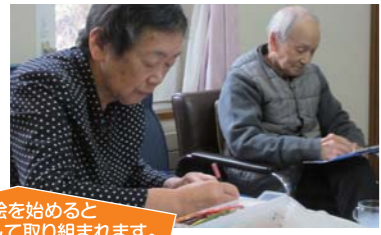
ぬり絵を始めるとても集中して取り組まれます。とても美しく塗られました。