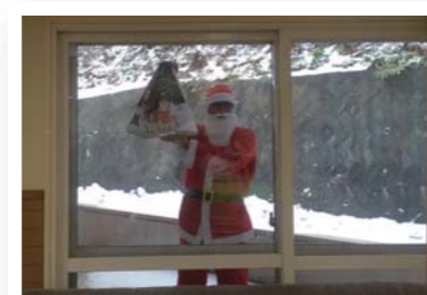
窓の外にサンタクロース発見!

12月25日(水)恒例のクリスマス会を開催致しました。ケーキとシャンメリーのおやつタイムの後、サンタの格好をした職員がハンドベルを使って「星に願いを」を演奏し、ご利用者と「きよしこの夜」を演奏致しました。幻想的なろうそくの灯りの中で、きれいなベルの音色が響き、素敵なクリスマス会になりました。メリークリスマス♪