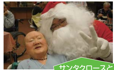
サンタクロースと一緒に♪

こんにちは!サンタクロースです!! 12/20(金)・12/24(火)にクリスマス忘年会を開催致しました。 クリスマスのご馳走にケーキ、そして職員からの様々なパフォーマンスをお楽しみいただきました。短い時間ではありましたが、皆様笑顔でお過ごしいただけたようで、とてもうれしく思っております。また、来年お会いしましょう!メリークリスマス♪