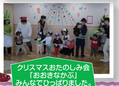
クリスマスおたのしみ会「おおきなかぶ」みんなでひっぱりました。