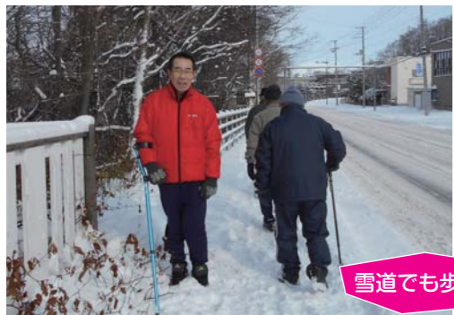
雪道でも歩行訓練