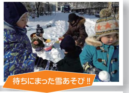
待ちにまった雪あそび!!