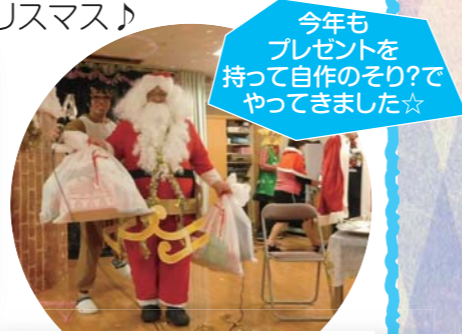
今年もプレゼントを持って自作のそり?でやってきました☆