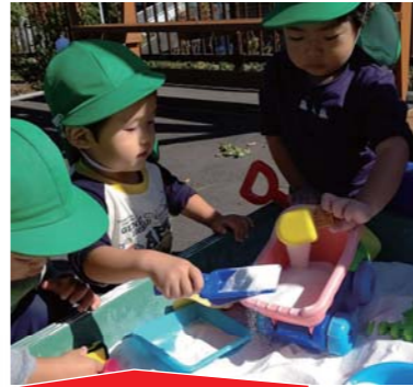
大好きな砂遊びに夢中です