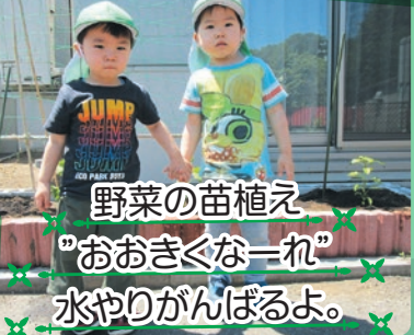
野菜の苗植え "おおきくなーれ" 水やりがんばるよ。