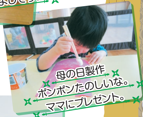
母の日製作 ポンポンたのしいな。 ママにプレゼント。