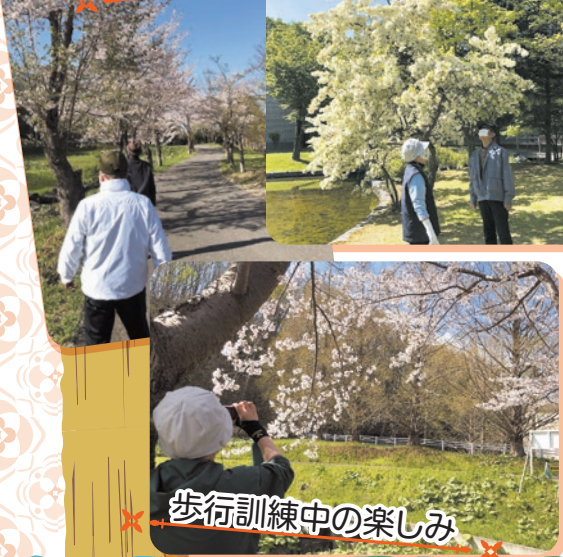
歩行訓練中の楽しみ