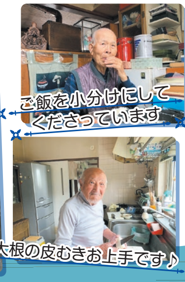
ご飯を小分けにして くださっています