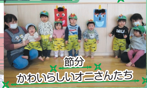
節分 かわいらしいオニさんたち