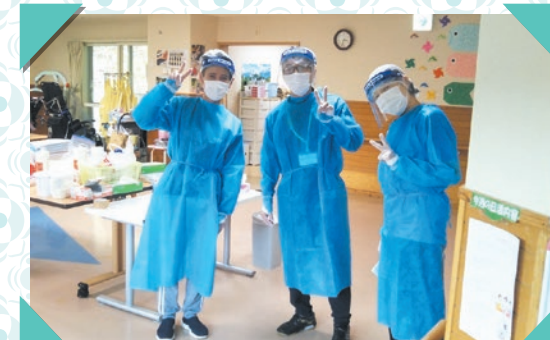
ご利用を安心させる笑顔を忘れずに