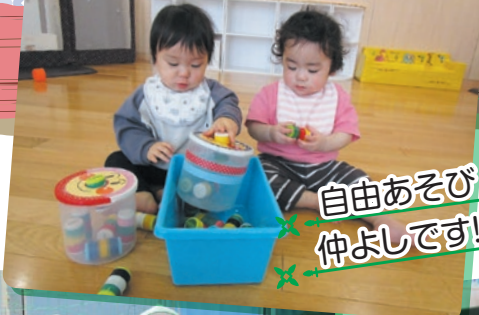
自由あそび 仲よいです!!