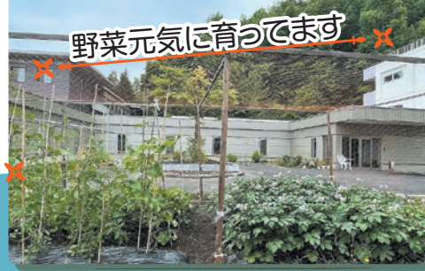
野菜元気に育ってます