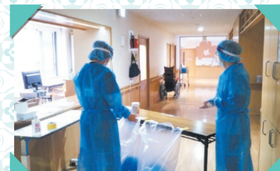
保健所ナースからの助言・指導を得てゾーニング対応

新型コロナウイルスワクチンの接種が少しずつ進み、当法人職員・入居利用者のワクチン接種も目途が立って参っております。しかし、この新型コロナウイルスとの闘いは、これからも続きます。この闘いが長期化する今、全ての国民が被災者という認識のもとで、ご利用者と職員、地域住民、関係機関の皆様と手を携え、歩んでいく必要があります。職員一同「感染しない」「感染させない」「拡げない」を基本に、これからも感染防止に取り組んで参りますので、皆様のご理解とご協力をお願い申し上げます。