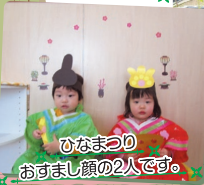
ひなまつり おすまし顔の2人です。