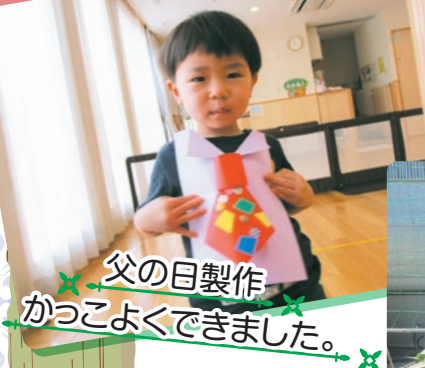
父の日製作 かっこよくできました。