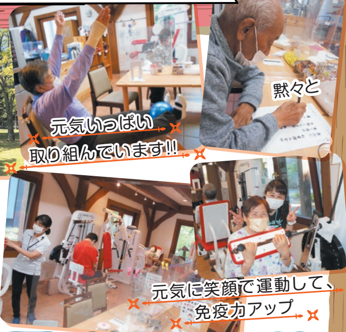
元気いっぱい 取り組んでいます!! 黙々と 元気に笑顔で運動して、 免疫力アップ