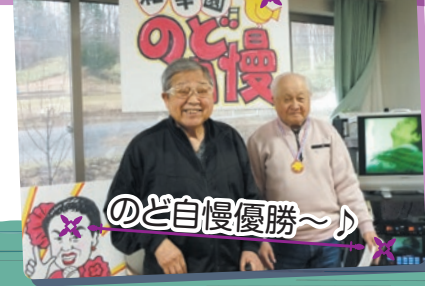
和幸園のど自慢 のど自慢優勝~♪