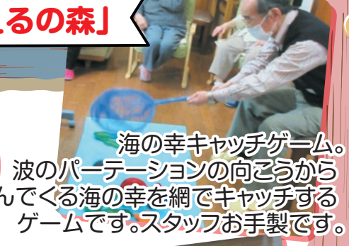
海の幸キャッチゲーム。 波のパーテーションの向こうから 飛んでくる海の幸を網でキャッチする ゲームです。スタッフお手製です。