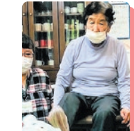
のえるの森では 身体を動かしながら楽しんで頂ける ゲームを沢山ご用意しています