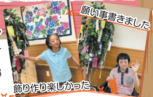
願い事書きました

《七夕》 ホールで七夕の飾り付けをしました。毎年、短冊に願い事を書いて頂いています。家族の健康、コロナの終息、秘密の願い事など楽しそうに書かれていました。飾りも個性が光ります。