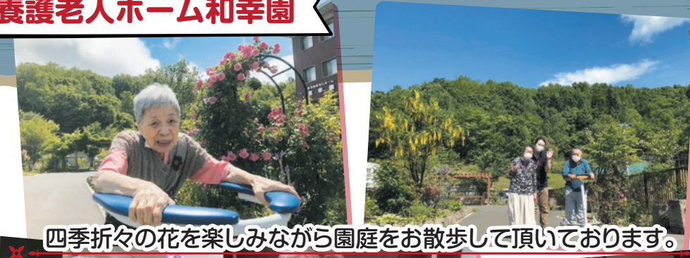
四季折々の花を楽しみながら園庭をお散歩して頂いております。