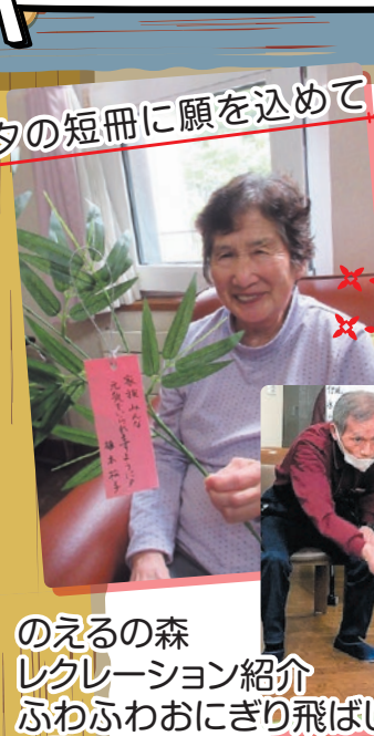
のえるの森 レクレーション紹介 ふわふわおにぎり飛ばしゲーム