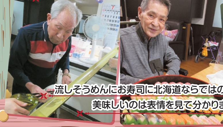
流しそうめんにお寿司に北海道ならではのジンギスカン♪ 美味しいのは表情を見て分かりますね。