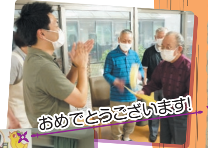
おめでとうございます!