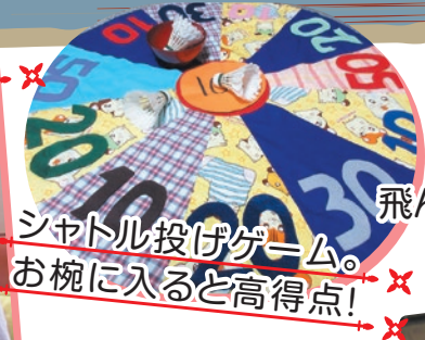
シャトル投げゲーム。 お椀に入ると高得点!