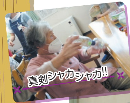
真剣シャカシャカ!!

和幸園デイサービスセンターでは、6月にゲーム大会を開催しました♪タイムを競うので、皆さん全力の白熱ゲームでしたよ~!!4月にはのど自慢大会も行いました。職員とのデュエットや、聞き惚れる程の美声で楽しいひと時となりました(*^_^*)