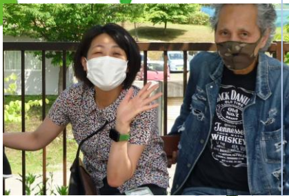
あったかくていい天気♪