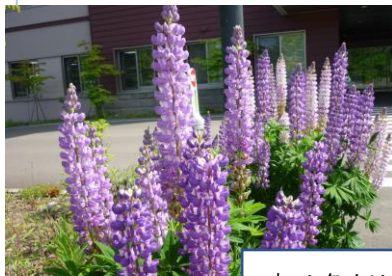
庭は色とりどりのお花が沢山♡