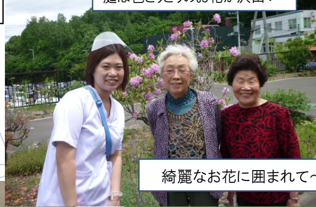
綺麗なお花に囲まれて～♪